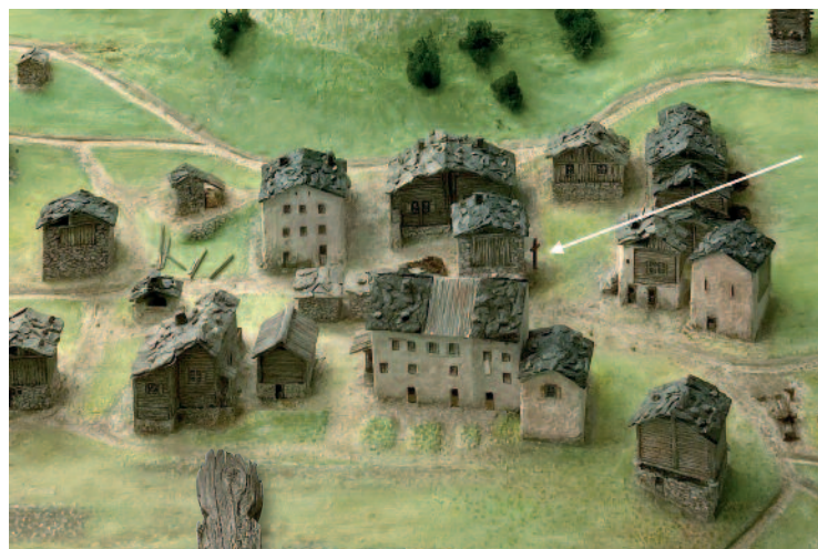
Maquette de Randonnaz: la flèche indique l'endroit où était la croix