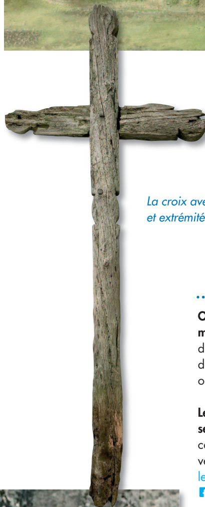
La croix avec traverse encastrée mi-bois et extrémités arrondies.