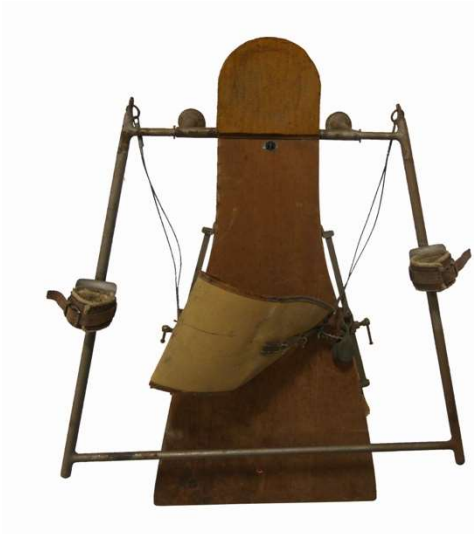
Un massage cardiaque par l'intermédiaire d'une ceinture.

Posée à côté comme un sésame inséparable, une notice d'utilisation répond.