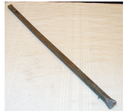
N° Fy 00081, barre à mine

Conservés aux Archives de l'État du Valais, les protocoles des séances du conseil communal de Fully révèlent la vie communale, bourgeoise et religieuse dans la deuxième moitié du 19 ème siècle. Si l'essentiel des séances traite de l'organisation des travaux dans les portions et sur le coteau, des cocasses affaires de maraudage ou encore de l'administration de la petite commune, une phrase joliment écrite à l'anglaise et à l'encre retient l'attention. Il s'agit de la construction d'un chemin dans la forêt des Garettes en remplacement d'un ancien sentier difficile situé à l'Ouest. L'idée devait trainer un peu dans le milieu des alpages car dans le protocole de la séance du conseil communal du 17 juin 1883 il est mentionné ce qui suit :