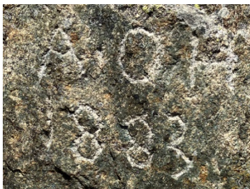
L'inscription : A. CH 1883

Nous remercions vivement tous les bénévoles qui ont participé le 12 mai dernier à la journée de documentation, de restauration et d'entretien !