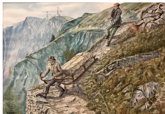
Un chemin à traineau par le Larzay