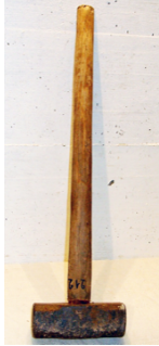
N° Fy 00212, Masse

Masse, barre à mine, gourdes et marteaux peuvent raconter au visiteur du Musée l'étonnante épopée de la création du chemin des Garettes au col de Sorniot, il y a 140 ans.