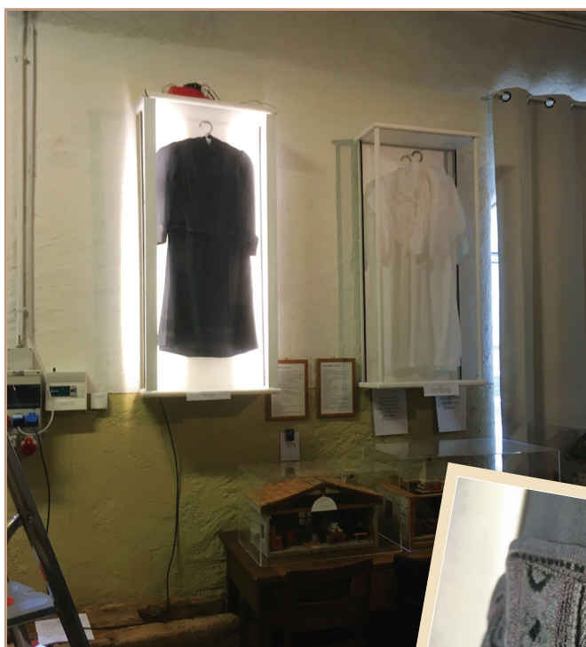
travaux d'éclairage. mise en lumière...

Elles sont nécessaires car seule l'absence de poussière, d'insectes ou de moisissures assureront la conservation à long terme des collections. C'est la raison pour laquelle nous avons rajouté 3 nouveaux tapis absorbeurs de poussière devant de la porte du musée.