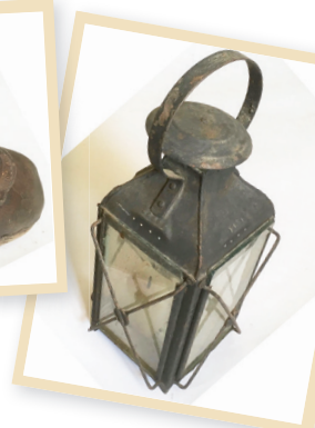
lampe à bougie