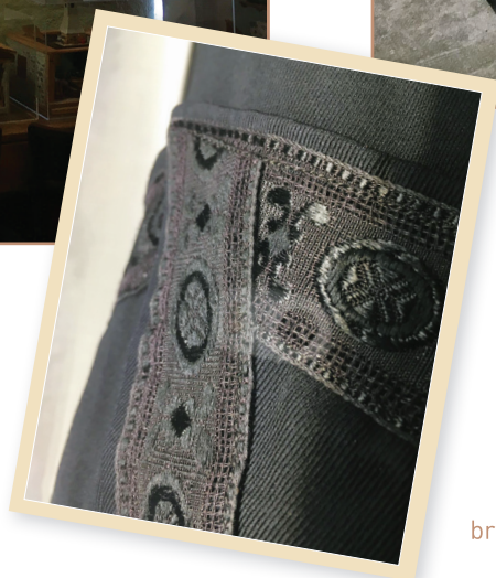
broderie d'une robe