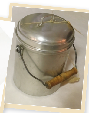
bidon à lait