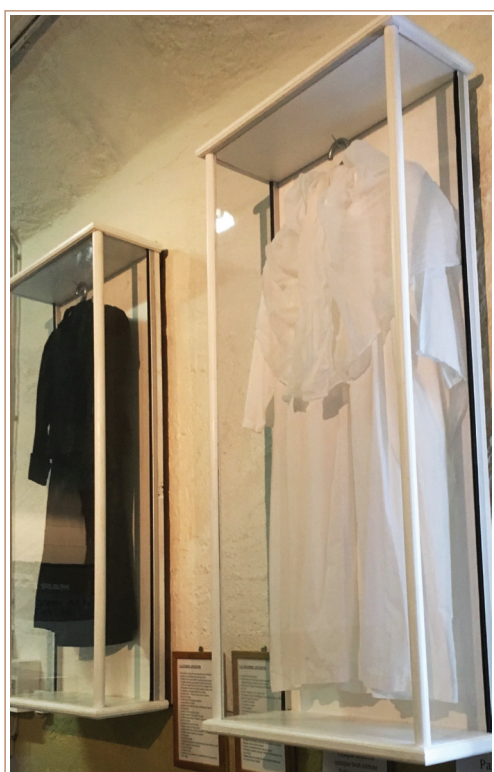
Les vitrines agrémentent les parois du local

Grâce à Willy Grange, 5 nouvelles vitrines murales agrémentent les parois du local sud. A l'intérieur des vêtements précieux sont désormais visibles. Nous avons également alimenté les déshumidificateurs par une installation électrique fixe.