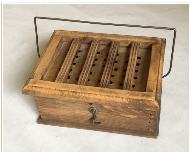
Un chauffe-pieds élégant