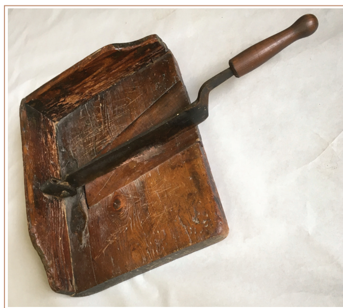
Un coupe-pain avec une butée interchangeable