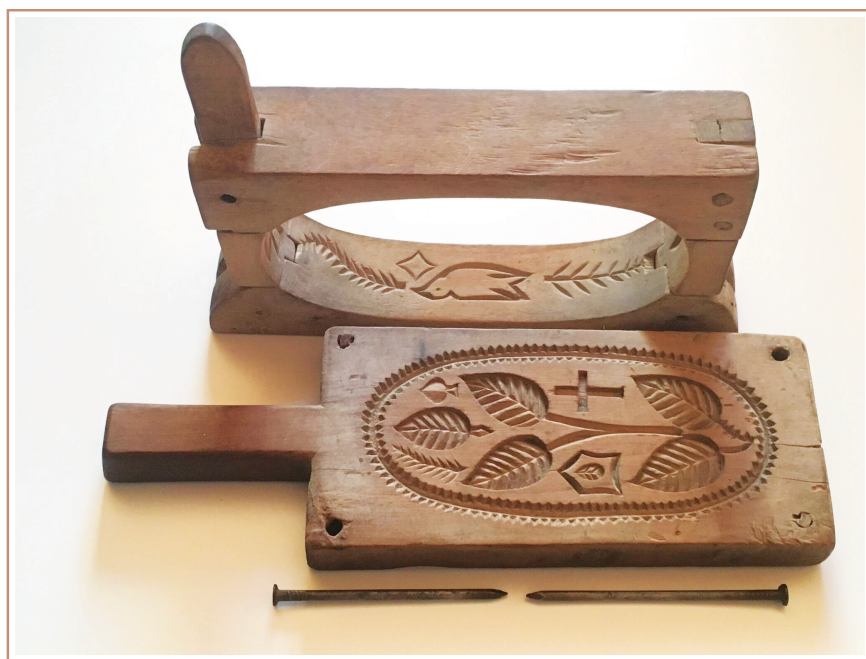
de délicats motifs pour ce moule à beurre