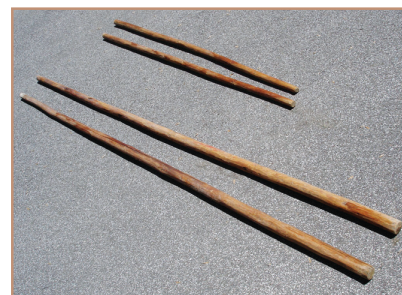
des perches pour l'au-delà