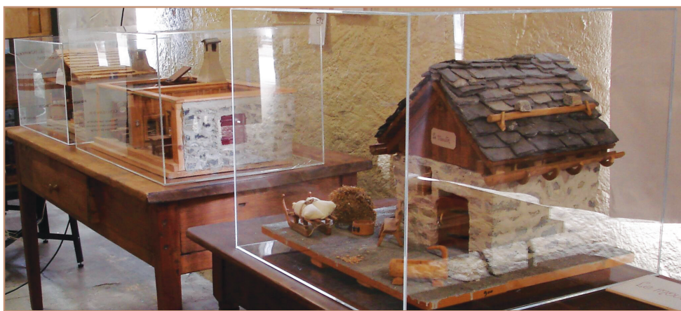
maquettes sous vitre

Un déshumidificateur de secours fut installé cet hiver afin de garantir une humidité recommandée pour le local et surveillée par des capteurs et enregistreurs.